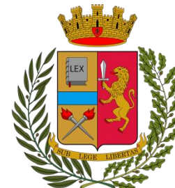
Polizia di Stato