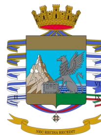
Guardia di Finanza